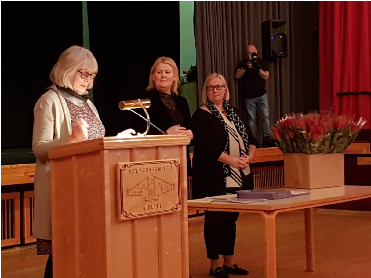
Úthlutun styrkja úr Uppbyggingarsjóði Vesturlands

Áhersluverkefni Sóknaráætlunar Vesturlands eiga öll upphaf sitt í aðgerðaráætlun sóknaráætlunar. Á árinu 2018 var unnið að sjö verkefnum á Vesturlandi. Verkefnin og verkefnastjórar voru þessi: