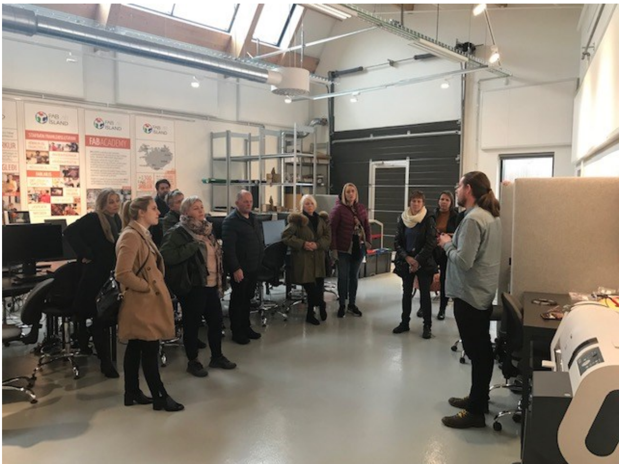
Heimsókn í Fab-Lab smiðjuna á Selfossi

Aðkoma Atvinnuráðgjafar að sóknaráætlun og verkefnum henni tengdum eru töluverð, atvinnuráðgjafar verkstýrðu eða sátu í verkefnisstjórnnum einstakra verkefna. Fyrirspurnir og erindi til Atvinnuráðgjafar eru 3 – 4 þús. á ári af ýmsum toga eins og verkefnalistinn hér að ofan gefur til kynna.