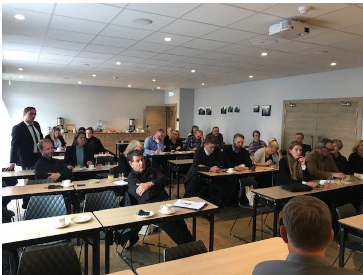
Fundur með þingmönnum Norðvesturkjördæmis

Í samræmi við lög SSV ber að leggja fram ársskýrslu um starfsemina á aðalfundi ár hvert. Starfsmenn SSV hafa unnið að því undanfarið að taka saman þá skýrslu sem hér er lögð fram. Það er von okkar að skýrslan gefi glögga mynd af þeim verkefnum sem SSV sýslar með og verði sveitarfélögum, fyrirtækjum, stofnunum, hagsmunasamtökum og einstaklingum góð heimild um starfsemina. Tilgangurinn með útgáfu á skýrslu sem þessari er líka að fræða og miðla þekkingu á þeim verkefnum sem unnin eru á vettvangi landshlutasamtaka, gera þær upplýsingar aðgengilegri og stjórnsýsluna gagnsærri og opnari.