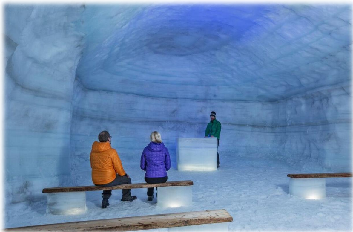
ÍSGÖNGIN Í LANGJÖKLI (OPNUÐ Í JÚNÍ 2015)

Vesturlandsstofa rekur Upplýsingarmiðstöð í Borgarnesi sem flokkast undir Landshlutamiðstöð og sér Sonja Hille um daglegan rekstur hennar. Gestir á árinu 2015 voru um 11.000 manns og er það aukning um 3.000 milli ára. Opnunartími yfir veturinn er 09:00-17:00 virka daga. Yfir Sumartímann er opið 09:00-18:00 virka daga, á laugardögum 10:00-16:00 og sunnudögum 12:00-16:00.