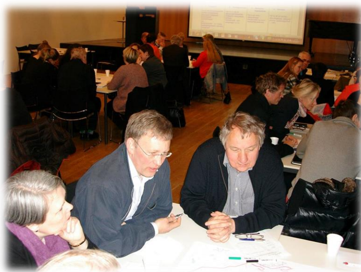
SÓKNARÁÆTLUN VESTURLANDS – STEFNUMÓTUNARFUNDUR Í BORGARNESI