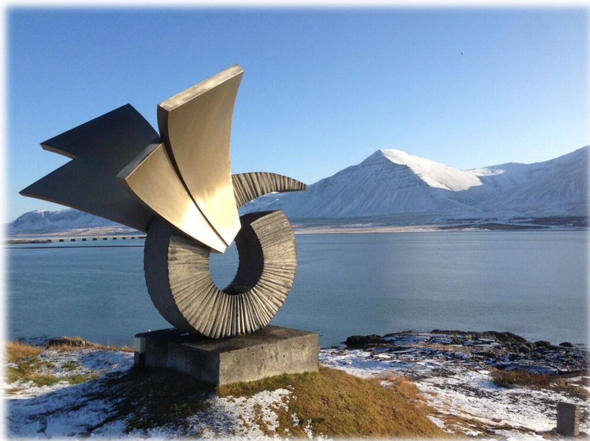
MINNISMERKIÐ BRÁKIN Í BORGARNESI

Í samræmi við lög SSV ber að leggja fram ársskýrslu um starfsemi á aðalfundi ár hvert. Starfsmenn SSV hafa unnið að því undanfarið að taka saman þá skýrslu sem hér er lögð fram. Það er von okkar að skýrslan gefi glögga mynd af þeim verkefnum sem SSV sýslar með og verði sveitarfélögum, fyrirtækjum, stofunum, hagsmunasamtökum og einstaklingum góð heimild um starfsemina. Tilgangurinn með útgáfu á skýrslu sem þessari er líka að fræða og miðla þekkingu á þeim verkefnum sem unnin eru á vettvangi landshlutasamtaka, gera þær upplýsingar aðgengilegri og stjórnsýsluna gegnsærri og opnari.