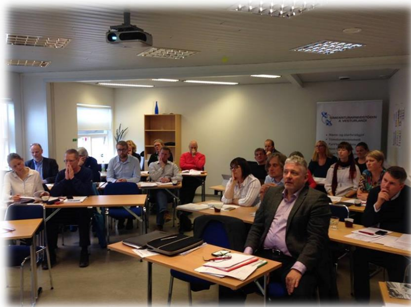
RÁÐSTEFNA UM LÝÐRÆÐI, ÞJÓNUSTU OG ATVINNUÞRÓUN Í SVEITARFÉLÖGUM Á ÍSLANDI, GRÆNLANDI OG Í FÆREYJUM (LOKAÞÁTTUR RANNSÓKNAR SEM UNNIN VAR FYRIR STYRK FRÁ NORDREGIO)