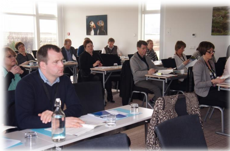
AÐALFUNDUR SSV Á HÓTEL HAMRI