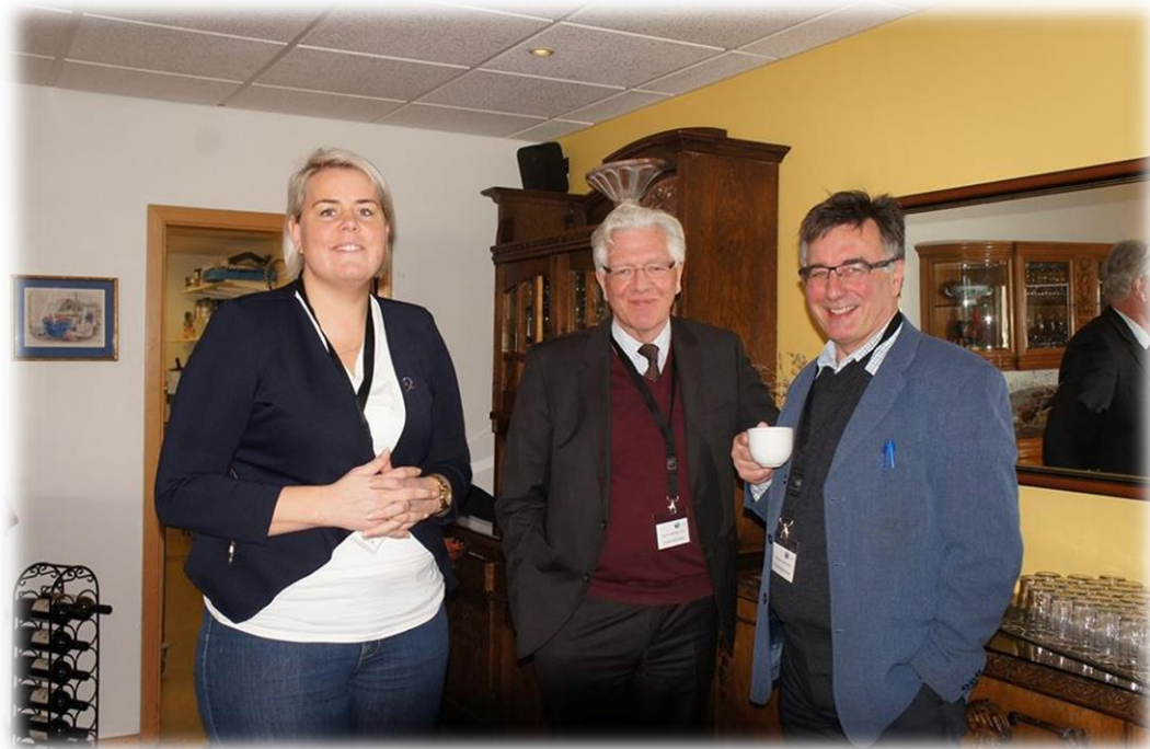
HAUSTÞING SSV Á HÓTEL GLYM

Líflegar umræður urðu um samgöngumál þar sem flestir fundarmanna og gestir tóku þátt og í lok umræðna var skorað á stjórn SSV að hefja vinnu við gerð samgönguáætlunar fyrir Vesturland.