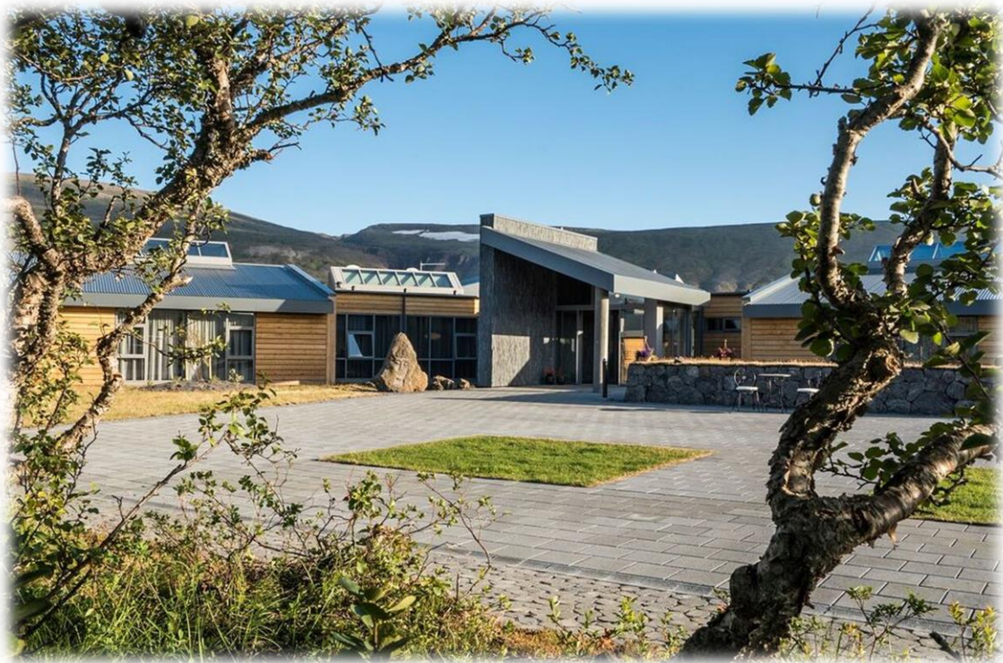
HÓTEL HÚSAFELL – (OPNAÐ Í JÚLÍ 2015)

Uppskeruhátíð var haldin í Borgarnesi. Dagurinn var með léttara sniði en áður hefur verið, byrjað var á Landnámssetri Íslands þar sem léttur hádegisverður var í boði. Því næst var farið í Hugheima og starfsemin skoðuð. Þá var farið í Safnahús Borgarfjarðar og síðan í Ljómalind þar sem léttar veitingar voru í boði. Að því loknu var farið upp á Hvanneyri þar sem Landbúnaðarsafn Íslands, Ullarselið og Skemman kaffihús kynntu starfsemi sína. Dagurinn endaði svo á Icelandair Hótel Hamri í kvöldverð.