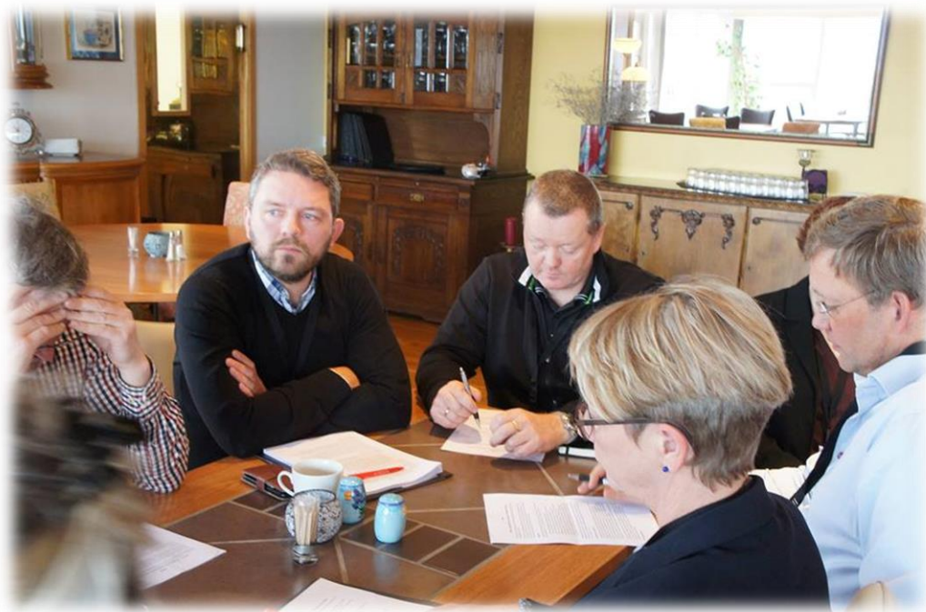
HAUSTÞING SSV Á HÓTEL GLYM