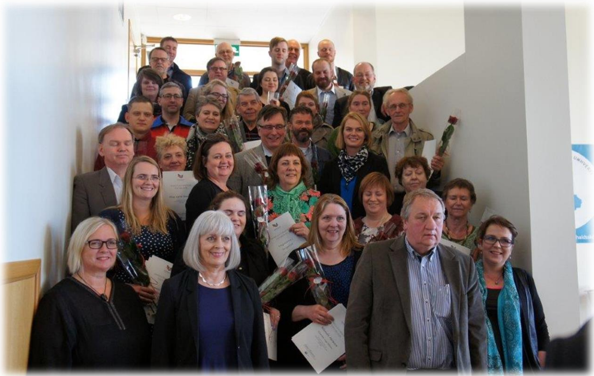
FRÁ AFHENDINGU STYRKJA ÚR UPPBYGGINGARSJÓÐI VESTURLANDS 2015

Á árinu 2015 hafði Uppbyggingarsjóður Vesturlands alls 50 milljónir til að ráðstafa og úthlutaði kr. 48.455.000 til 90 verkefna. Sjá lista yfir úthlutanir í Viðauka.